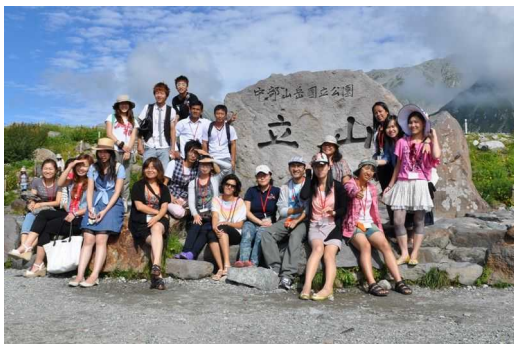
International Students Summer Trip