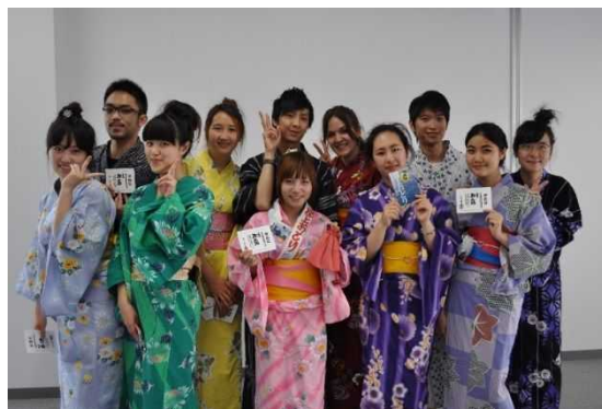
【郡上おどり講習会】