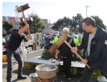
Traditional Culture Experience