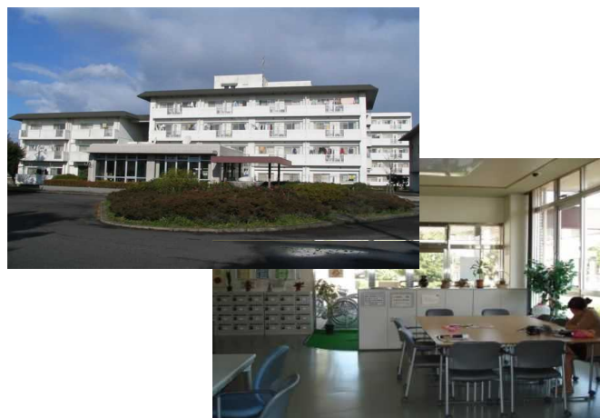
【国際交流会館の外観とロビー】

鉄筋コンクリート4階建（A棟）・5階建（B棟） 部屋数 単身室69室・夫婦室14室・家族室7室 （単身室A棟5,900円/月・B棟4,700円/月）