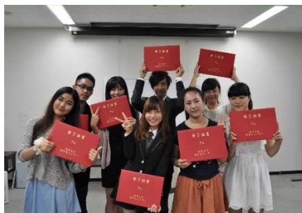
【Students who finished this course in August 2013】