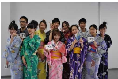
【Gujo Dance Workshop】